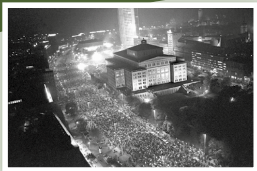
Demonstrationszug auf dem Leipziger Ring am 9. Oktober 1989