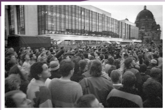
Demonstranten am 7. Oktober 1989 Eine Polizeikette schirmt den Palast der Republik ab