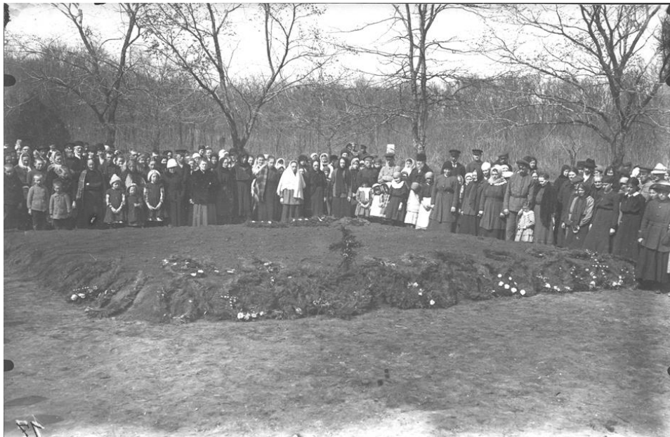
Massengrab der Opfer der Pogrome im Bürgerkrieg, Kolonie Blumenort, Ukraine, 1919

Im Schwarzmeergebiet wurden deutsche Siedler Opfer zahlreicher Pogrome und gerieten oft zwischen den Fronten des Bürgerkriegs.