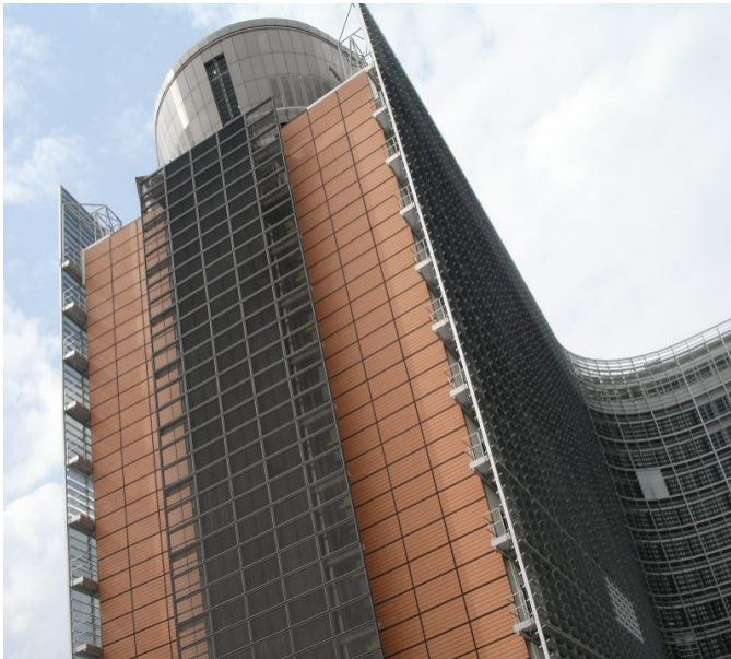
Kommissionsgebäude in Brüssel, Symbol für die Regelungswut der EU

Für die Europäische Kommission arbeiten etwa 20.000 Beamtinnen und Beamte - das sind weniger als in einer durchschnittlich mittelgroßen deutschen Stadt. Sie sind hoch qualifiziert und werden entsprechend bezahlt, denn von den EU-Beamtinnen und -Beamten wird viel verlangt: Perfekte Kenntnisse von mindestens zwei Amtssprachen, häufige Ortswechsel und Belastungen für die Familien durch lange Auslandsaufenthalte. Was häufig vergessen wird: Deutsche Beamte und Angestellte, die in Brüssel für die deutsche Botschaft oder die Vertretungen der Länder arbeiten, verdienen vergleichsweise mehr als ihre EU-Kollegen in Brüssel. Die EU-Beamten zahlen wie alle anderen Unionsbürger auch Steuern: Ihre Einkommenssteuer fließt in den Unionshaushalt.