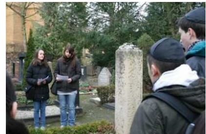
Schülerreferat auf dem Friedhof Weißensee

Schüler der neunten Klasse der Carl-Zeiss-Oberschule (Berlin-Lichtenrade) begeben sich in diesem Jahr auf eine historisch-kulturelle Spurensuche in Berlin. In Kleingruppen beschäftigen sich die Schüler mit dem Lebensweg eines verstorbenen Berliner Mitbürgers jüdischen Glaubens, der auf dem Friedhof Weißensee begraben ist. Die Referate, die dabei entstehen, werden auf dem Friedhof Weißensee am Grab des Verstorbenen vorgetragen. In der anschließenden Schreibwerkstatt in der Schule arbeiten die Jugendlichen die Ergebnisse unter fachlicher Anleitung zu Kurzbiografien um, die sie später in einem Fotokalender mit Bildern von Gräbern des Friedhofs Weißensee veröffentlichen.