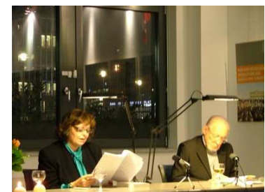
Ana Blandiana und Hans Bergel im Europasaal

Am 17. Februar veranstaltete die Deutsche Gesellschaft e. V. in Zusammenarbeit mit dem Rumänischen Kulturinstitut „Titu Maiorescu“ eine Lesung und Podiumsdiskussion mit Ana Blandiana und Hans Bergel. Die rumänische Schriftstellerin Ana Blandiana stellte ihren Gedichtband „Die Versteigerung der Ideen – Gedichte“ vor, der in der Übersetzung von Hans Bergel erschienen ist.