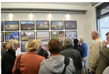
Ausstellung im Europasaal

Am 4. April 2011 wurde im Europasaal der Deutschen Gesellschaft e. V. die Ausstellung „Tatort-Fotos eines Verbrechens in Deutschland. Die Mauer 1961-1989“ mit rund 80 Gästen feierlich eröffnet. Ludwig A. Rehlinger, Staatssekretär a. D. im Bundesministerium für innerdeutsche Beziehungen und Ehrenvorsitzender der Deutschen Gesellschaft e. V., eröffnete die Vernissage.