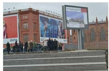
Informationstafeln auf der Berliner Schlossfreiheit

Die Deutsche Gesellschaft e. V. begleitet die Initiative zur Errichtung eines nationalen Denkmals bereits seit 2005 mit Vorträgen, bundesweiten Diskussionsrunden und Hearings. Von März bis Oktober 2011 ist auf der Schlossfreiheit in