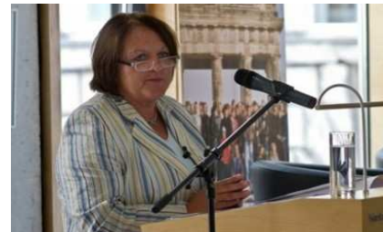
Bundesministerin der Justiz Sabine Leutheusser-Schnarrenberger