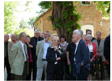
Exkursion des Freundeskreises