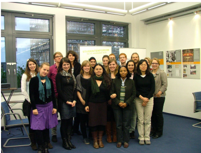
Teilnehmende des Studentenforums

Die Deutsche Gesellschaft e. V. veranstaltete vom 18. bis zum 19.11. 2010 ein Studentenforum mit dem Titel „Werkstatt Einheit“.