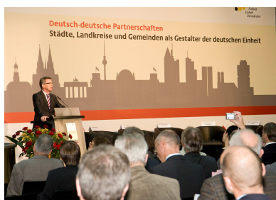
Dr. Thomas de Maizière auf dem Partnerschaftskongress

Am 27. und 28. September 2010 führte die Deutsche Gesellschaft e. V. im Auftrag des Bundesministers des Innern und Beauftragten der Bundesregierung für die Neuen Bundesländer Dr. Thomas de Maizière einen zweitägigen Partnerschaftskongress in Berlin (in den Räumlichkeiten der Allianz-Repräsentanz, Pariser Platz 6, 10117 Berlin-Mitte) durch. An der Veranstaltung zum Thema „Deutsch-deutsche