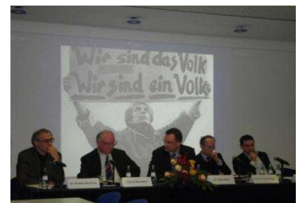
Podiumsdiskussion in Düsseldorf

Die Deutsche Gesellschaft e.V. informiert seit Jahren mit Vorträgen, Diskussionsrunden und Hearings über die Entstehung eines Freiheits- und Einheitsdenkmals, das auf der Berliner Schlossfreiheit errichtet werden soll.