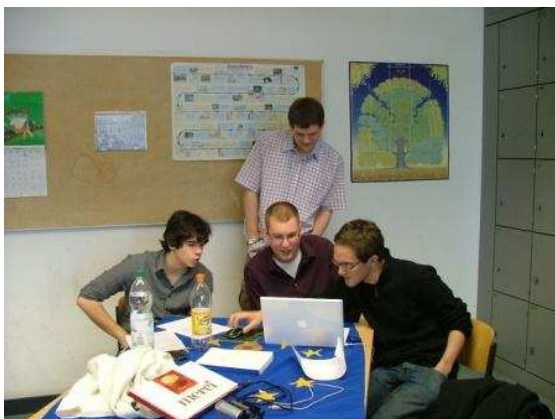
Video-Workshop des EIZ Berlin

Nach dem großen Erfolg des Schulprojekts "Berliner Wahrheiten über die EU" wurde es auch in diesem Herbst fortgesetzt. Schülerinnen und Schüler wurden aufgefordert sich jenseits der verbreiteten Meinungen und Vorurteile eigene Gedanken über die EU zu machen - und dann mit selbst gedrehten Videoclips zu erzählen, was sie über Europa und die EU denken.