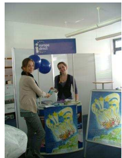
Infostand des EIZ Berlin

Nach dem großen Erfolg des Schulprojekts "Berliner Wahrheiten über die EU" wurde es auch in diesem Herbst fortgesetzt. Schülerinnen und Schüler wurden aufgefordert sich jenseits der verbreiteten Meinungen und Vorurteile eigene Gedanken über die EU zu machen - und dann mit selbst gedrehten Videoclips zu erzählen, was sie über Europa und die EU denken.