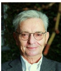
© Prof. em. Hans Mathias Kepplinger

Geb. 1973 in Leipzig; 1993-2001 Studium der Fächer Publizistik, Volkswirtschaftslehre und Politikwissenschaft an der Universität Mainz; 2002-2003 Volontariat beim Hessischen Rundfunk (TV und Radio) mit Stationen im ARD-Hauptstadtstudio Berlin und bei der Deutschen Welle in Washington D. C. (USA); 2003-2012 Reporterin in der Wirtschaftsredaktion („mex“ und „plusminus“) beim Hessischen Rundfunk in Frankfurt a. M.; 2007 Friedrich-Vogel-Preis für Wirtschaftsjournalismus; 2012-2018 Reporterin und verantwortliche Redakteurin beim landespolitischen Magazin „defacto“ des Hessischen Rundfunks; aktuell Inlandskorrespondentin und Chefin vom Dienst für die Redaktion ARD-aktuell des Hessischen Rundfunks.