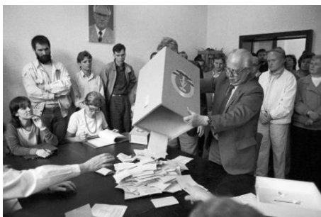
Bild 89_0507_DDR-Wahl 05